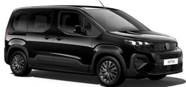
Schwarz Perla Nera