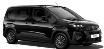
Nero Perla Nera