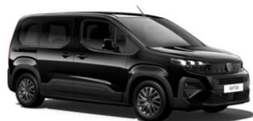
Nero Perla Nera