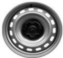
Radkappe 15" et 16" DEMI-STYLE