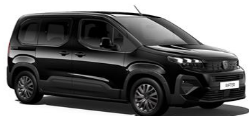
Noir Perla Nera