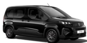
Nero Perla Nera