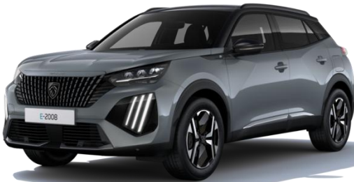
Grau Selenium LDM0 – Optional (ausser auf STYLE)