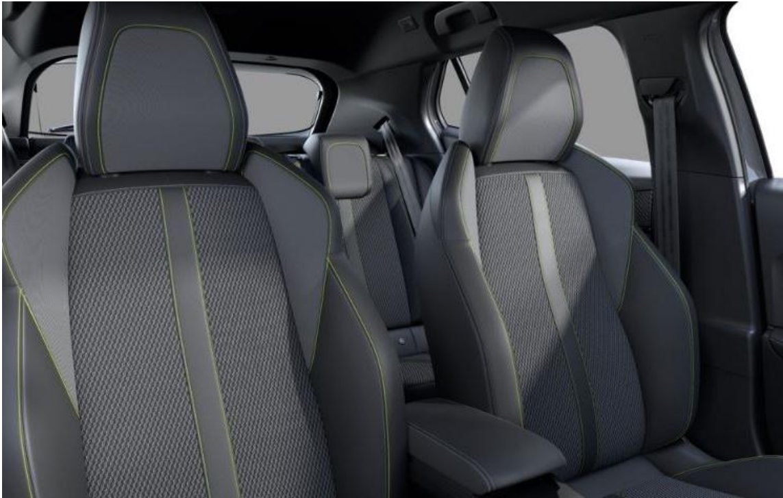
Stoff BELOMKA mit Kuntslederbezug Isabella, Tri-Material Uni Capy mit Ziernähten Grün Adamite