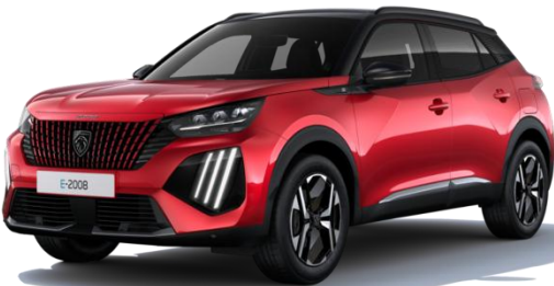
Rot Elixir VHM5 – Optional (ausser auf STYLE)