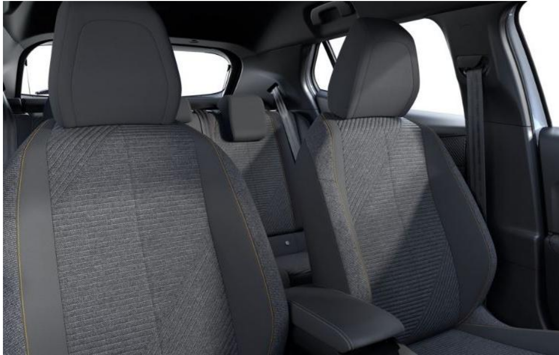
Stoff RENZO mit Ziernähten in Orange Sunrise