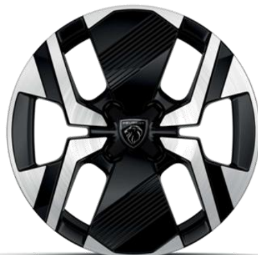
17-Zoll-Alufelgen glanzgedreht KARAKOY zweifarbig Schwarz Onyx und Glanzlack