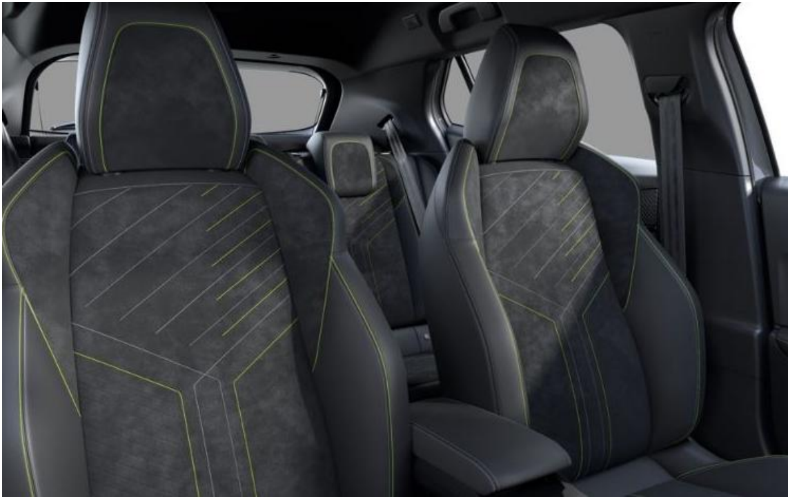
Alcantara® Mistral ICONIUM mit Kuntslederbezug Isabella, Tri-Material Alcantara® Schwarz mit Ziernähten Grün Adamite