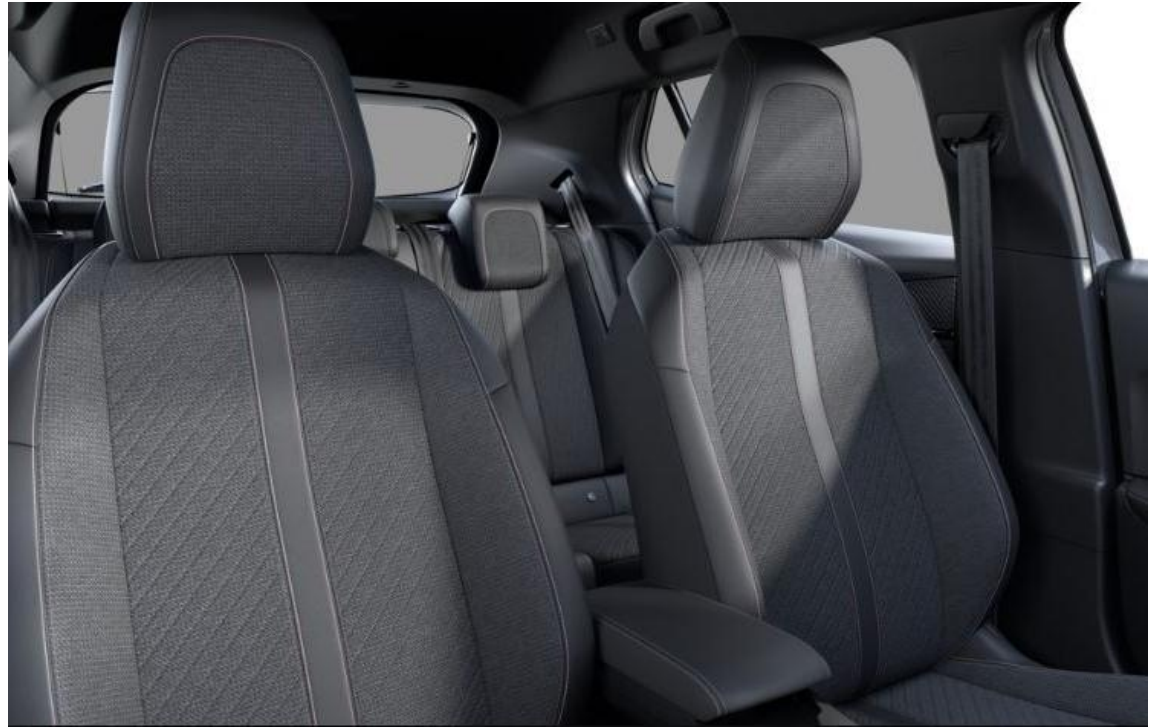
Stoff CASUAL LOMSA geprägt, Kuntslederbegleitung Isabella, Tri-Material LOMSA mit Ziernähten Quartz