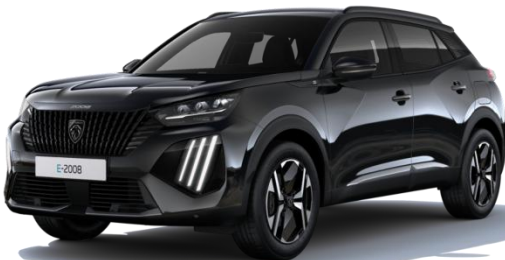
Schwarz Perla Nera 9VM0 – Optional