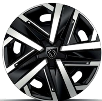
16-Zoll-Stahlfelgen mit Radkappen SILOM Grau Eclat & Schwarz Orbital, Mattlack