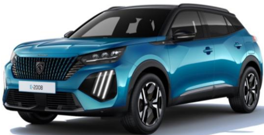
Blau Obsession DPM0 – Serienmässig (ausser auf STYLE) Optional auf STYLE