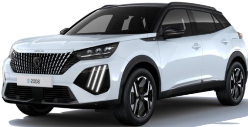
Weiss Okénite SUM0 – Serienmässig auf STYLE Optional auf ALLURE & GT