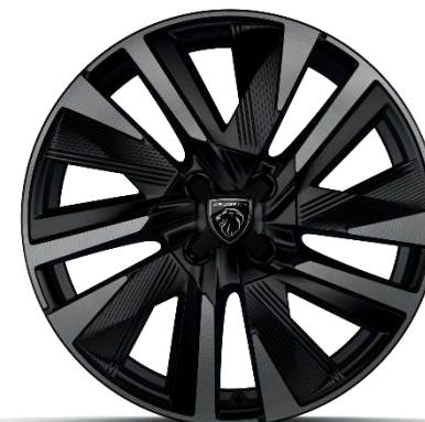
18-Zoll-Alufelgen glanzgedreht EVISSA zweifarbig Schwarz Onyx, Black Mist Lack, mit Einlagen in Schwarz Onyx matt

Optional auf GT (ausser mit dem Paket Winter)