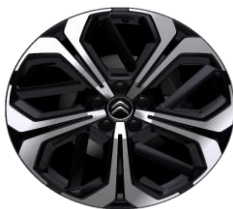
19" Aero X diamantées avec inserts noir série à partir de PLUS