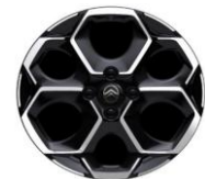
17" Alufelgen Atacamite auf MAX / ÉDITION TRICOLORE (ZIAP)