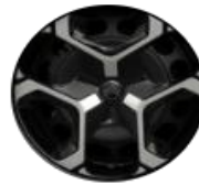
17" Radzierblende Azurite auf PLUS (ZIAA)