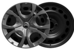
16" Radzierblende Pyrite auf YOU (ZIAB)