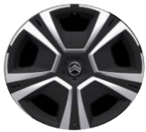
16"-Radzierkappen Steel & Design serienmässig auf YOU