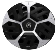
18"-Radzierkappen Aerotech serienmässig auf PLUS