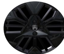
18"-Alufelgen Amber Black diamantgeschliffen serienmässig auf COLLECTION