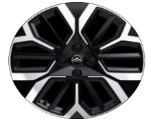
18"-Alufelgen Amber diamantgeschliffen serienmässig auf MAX